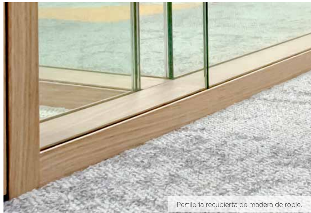
Perfilería recubierta de madera de roble.