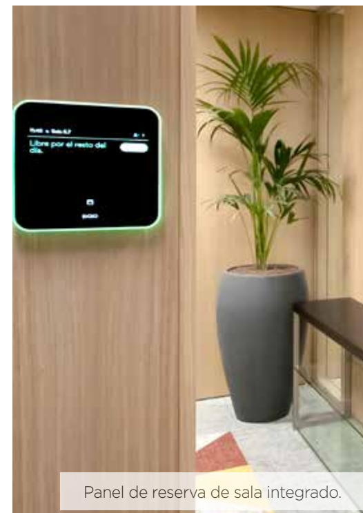
Panel de reserva de sala integrado.