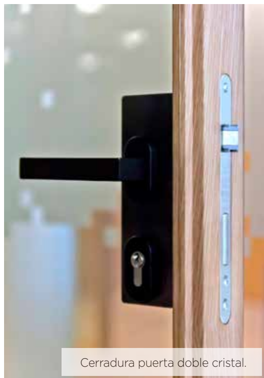
Cerradura puerta doble cristal.