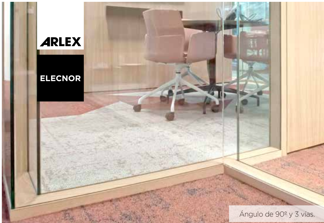
Ángulo de 90° y 3 vías.